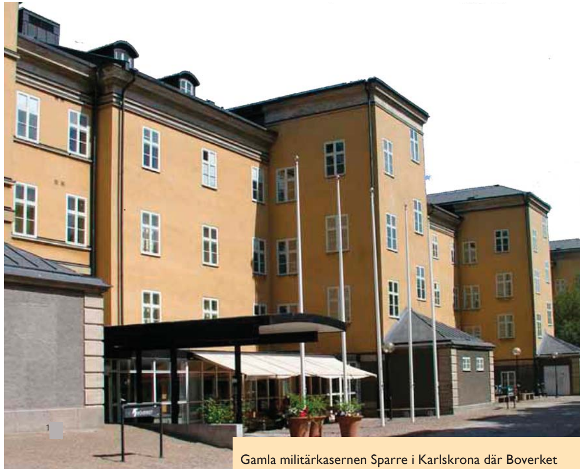
Gamla militärkasernen Sparre i Karlskrona där Boverket är beläget.