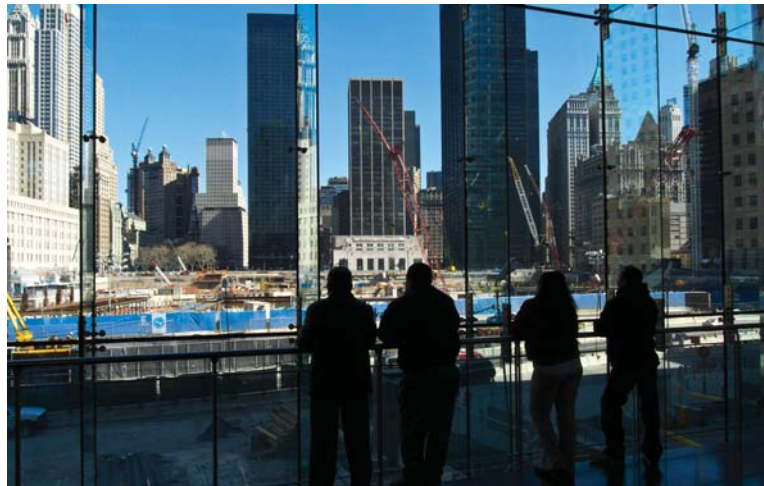
Urbanpolitik – statsvetenskapens svarta hål?

Förvisso. Men vid svenska lärosätten går det inte att läsa statsvetenskapliga kurser i bostadspolitik eller urbanpolitik; på sina håll möjligen i välfärdspolitik. Inte heller tycks statsvetare generellt göra några större avtryck i den internationella forskningen på området. När en av oss för några år sedan gjorde en enklare kvantitativ undersökning av saken bekräftades bilden att statsvetenskap har en mycket blygsam ställning. Av samtliga artiklar i de