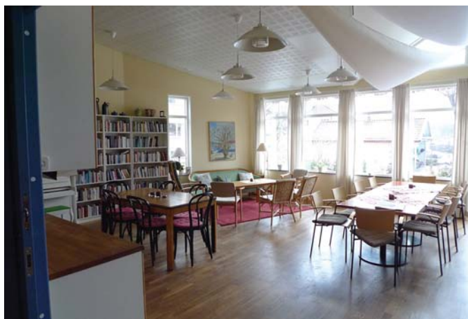
Boende för andra halvan av livet. Interiör från kollektivhuset Sockenstugan i Stockholm.

Vilka är då "de äldre"? Det är framförallt kvinnor och särskilt enboende kvinnor dvs. kvinnor som bor för sig själva. Redan i åldersgruppen 65–70 år lever inte mindre än omkring 40 procent av