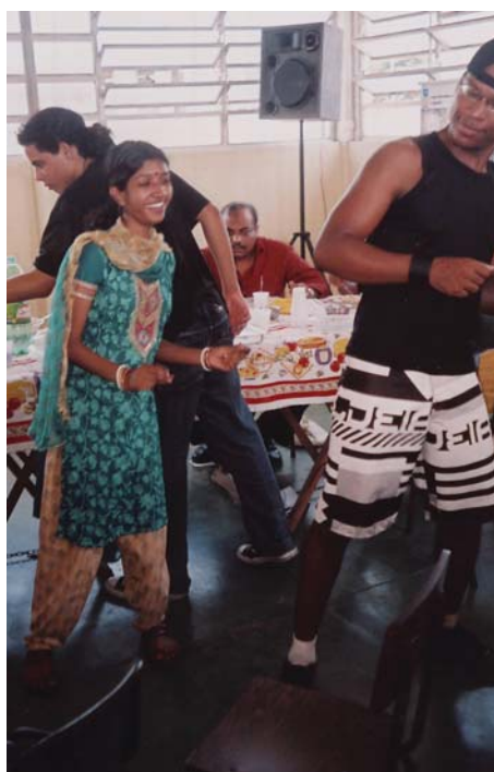
Besök i Cidade de Deus tillsammans med delegationen från Bangladesh

Barn och ungdomar får från början en viktig roll i arbetet, t.ex. med att kartlägga villkoren för barn och ungdomar, att ta fram en karta över lokalsamhället genom Google Earth och föra in olika sorters information. Tillsammans med alla som vill