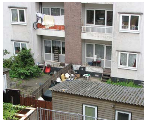
Social housing i Rotterdam

Våra resultat visar också på tydliga samband mellan bostadsmarknad och sysselsättning. Förhållanden på bostadsmarknaden skapar hinder för rörlighet på