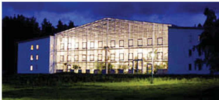
Boviera – trädgårdsvistelse året om!