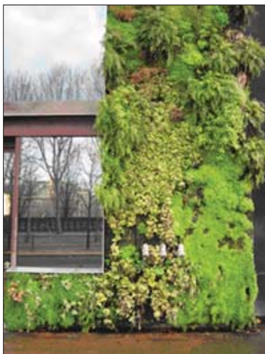
Vertikal trädgård, Paris

Ett sätt att angripa dilemmat utgår från fördelningen mellan byggd miljö och naturmiljö i staden, och rör sådant som storleken på och fördelningen av parker och esplanader. Här angrips alltså förtätningsdilemmat som ett designproblem, och en mängd olika innovationer kan hjälpa till att åtgärda problemet. Genom att exempelvis skapa vertikala trädgårdar och gröna tak eller takträdgårdar (se bilderna) går det att få in vegetation även i trånga stadsmiljöer. Dessa små fickor av grönt är kanske inte tillräckliga om man vill göra en utflykt eller gå en kvällspromenad, men de ger i alla fall en ofta uppskattad visuell kontakt med naturen, och kan kanske även bidra med väldoft och möjligheter till att studera fåglar och andra djur som lockas till vegetationen. De kan också ha en ekologisk funktion, exempelvis genom att absorbera och rena regnvatten. Med sådana åtgärder kan invånarna få en bättre livsmiljö, samtidigt som stadens negativa