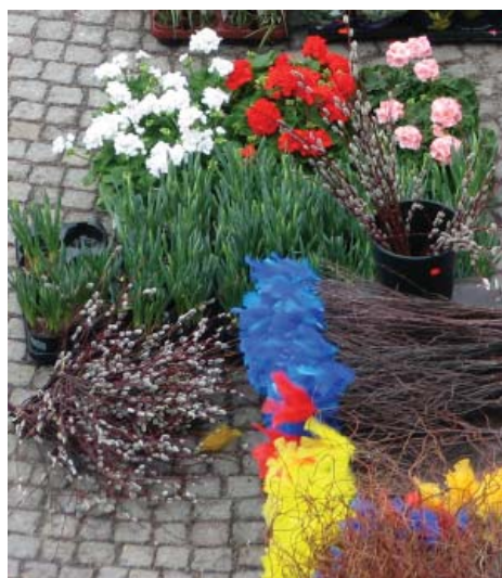
Utsikt från IBF:s lokaler i Rådhuset i april