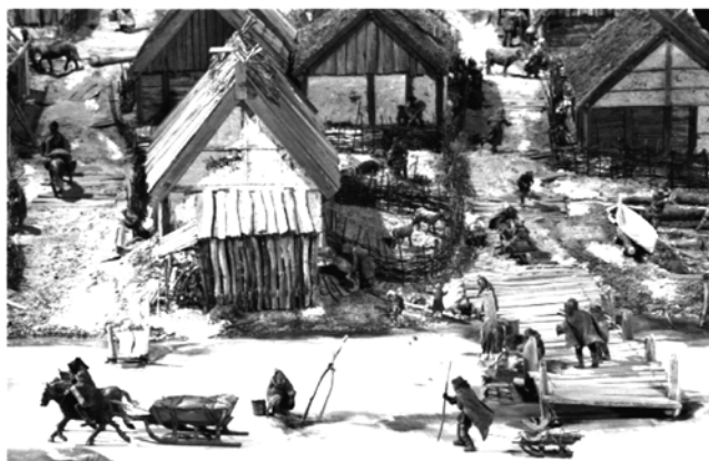
Svensk bostadsmarknad på 900-talet. Modell över hamnen i Birka, Björkö, Adelsö. Riksantikvarieämbetet.

Tydligast kommer den nya situationen till uttryck i Stockholmsregionen. Kommunerna bygger inte tillnärmelsevis så mycket som de borde göra med tanke på den stora inflyttningen till regionen. Delvis som en följd av detta stiger priserna på bostadsrätter och vil-