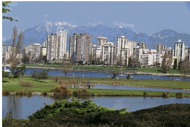
Vancouver är en av de vackraste städerna på jorden och därtill en av de mest mångkulturella

Det som också exemplifierades i flera studier samt presentation från Statcan och dess motsvarighet till Boverket (Canadian Mortgage and Housing Corporation) var att Kanada håller på att få mer tillgängliga registerdata på befolkningen. Dessa uppgifter håller