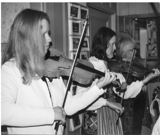
Folkdräkter och fiolmusik i Dalarna

Det empiriska materialet hämtas från arenorna sport och kultur i Leksand och Rättvik – och en bärande fråga är vilka roller dessa arenor har i den lokala utvecklingen. Vidare fokuseras det samarbete som kan urskiljas mellan frivilligsektorn, det lokala näringslivet och det kommunala utvecklings- och förändringsarbetet. Naturoperascenen Dalhalla är en av flera fallstudier. Dalhalla är ett exempel på ett projekt som först motarbetades av lokala kommunala beslutsfattare men som senare fick stöd från både lokala och regionala myndigheter och det privata näringslivet. Dalhallas existens bygger bland annat på en betydande insats av frivilligt arbete. Inom verksamheten finner vi flera olika nätverk på olika nivåer – inom det frivilliga arbetet med basen i byaföreningar, på den organisatoriska nivån med länkar till nationella musikintressen och lokala och regionala aktörer.