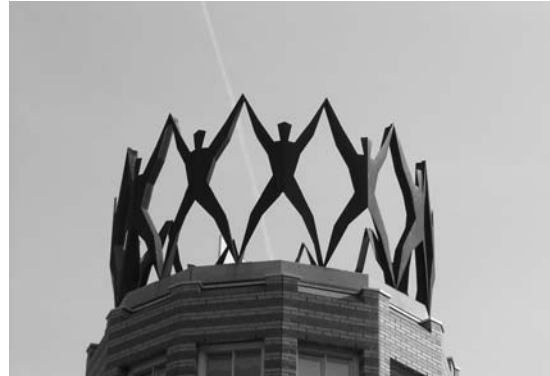
Center of excellence

Det sätter igång en febril aktivitet. Plötsligt talar forskare från olika fakulteter med varandra. Man kan se kemisten, som är specialiserad på miljöfarliga produkter, jaga ekonomer som kan göra samhällsekonomiska kalkyler, bara för att nämna ett exempel. Utifrån IBFs horisont är det tämligen enkelt att finna tematiska områden som binder samman många olika discipliner. I