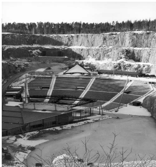
Naturoperascenen Dalhalla i vinterskrud

Kommunala aktörer riktar större delen av sina ansträngningar inom lokal utveckling mot det lokala näringslivet och inte mot föreningslivet och det frivilliga arbetet. De ser föreningslivet som en grogrund för idéer och samarbete men inte som en ekonomisk aktör. I föreliggande rapport uppmärksammas dock de ekonomiska aspekterna av sport- och kulturaktiviteter. Här problematiseras också hierarkierna inom och mellan de olika organisationerna samtidigt som ett ömsesidigt beroende uppmärksammas.