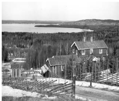
En by i Leksands kommun med Siljan i bakgrunden