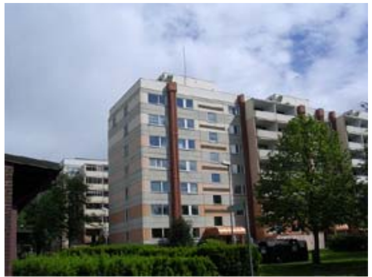
Råslätt i Jönköping är ett av de bostadsområden som studeras i avhandlingen

I avhandlingen framkommer att segregationsprocesserna i hög grad drivs av de mer resursstarka individernas beteende. De verkligt resursstarka tenderar att helt välja bort de bostadsområden (främst hyreshusområden) som har höga andelar arbetslösa och låginkomsttagare, och/eller en hög andel personer med utländsk bakgrund. Även hos befolkningen i områden med denna karaktär märks tydligt tendensen att det är de relativt välbeställda som lämnar områdena. Det rör sig främst om infödda svenskar och etablerade invandrare. De luckor som då uppstår fylls, på grund av den svaga efterfrågan från resursstarkare grupper, av personer med små valmöjligheter. Många av inflyttarna är nykomlingar i landet, i staden och/eller på bostadsmarknaden.