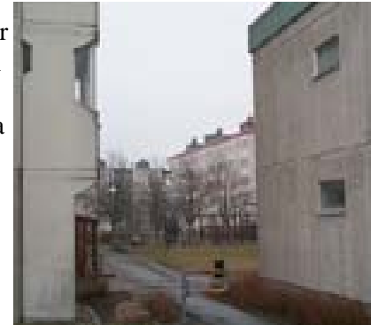
Allmännyttan i Tensta - där årets boställning äger rum.

Svensk bostadspolitik står därför inför ett dilemma; välj den sociala inriktningen och gå mot socialbostäder eller välj en marknadsinriktning och riskera politiskt motiverade utförsäljningar.