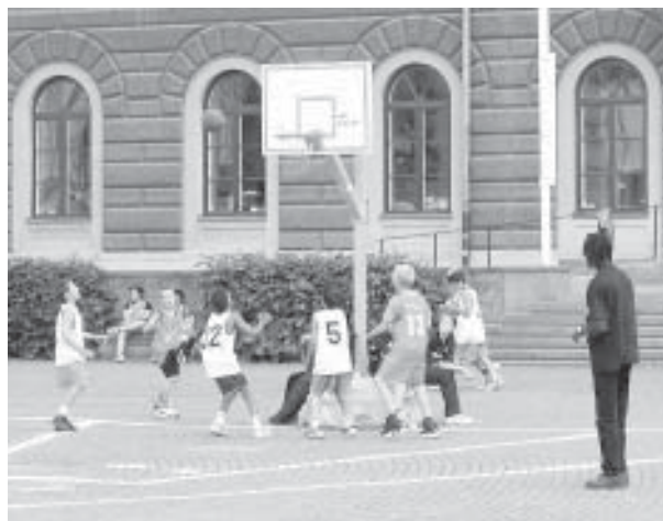
Ett gott exempel på gamla och nya svenskar som arbetar mot samma mål.

Forskningen visar också att det sätt som vi svenskar bemöter invandrarna på har stor betydelse för viljan till integration i samhället. Wallraffandet i valstugorna sände en kuslig signal till många invandrare: vi är välvilliga i våra publika framträdanden, men skrapa lite på ytan så kommer främlingsfientligheten, och flatheten mot främlingsfientligheten, fram.