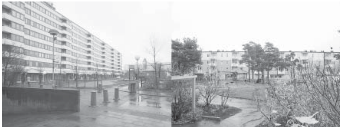
Bilder från bostadsområdet Norra Biskopsgården.

vanliga analyser av politiken, städerna och implementeringen i stadsdelarna har ett ambitiöst korsutvärderingselement förts in i analysen. I mindre grupper representerande åtminstone tre forskare från annat land har politiker och tjänstemän berörda av programmet intervjuats under en