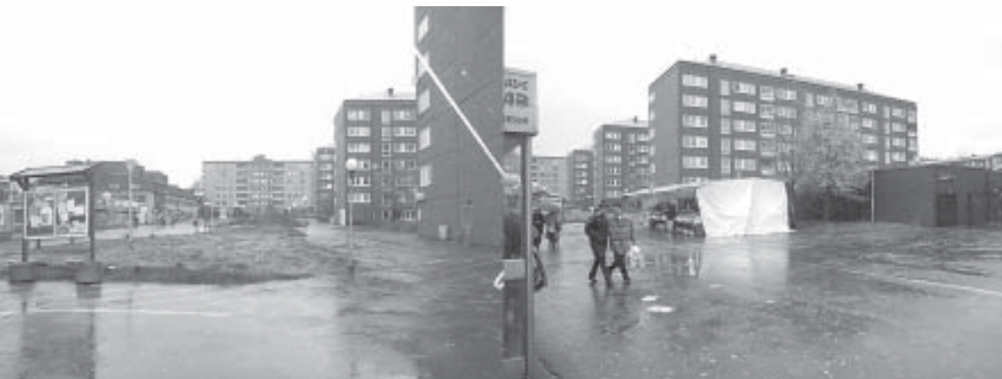
Bilder från bostadsområdet Hjällbo.

Projektets komparativa idé har drivits längre än vad som är vanligt i internationella projekt. Förutom att varje nationellt forskarteam gjort sed-