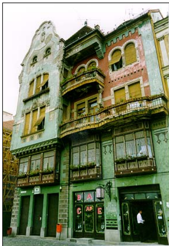
Piata Unirii, Timisoara

Fyra veckor där kontakter skapades med rumänska geografer och studenter med intensiv språkträning blev en vistelse som andades starka kontraster mellan det sköna och det mörka Rumänien.