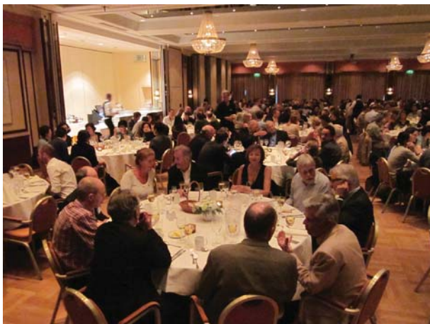
Konferensmiddagen vid Radison Blu Lillehammer Hotel