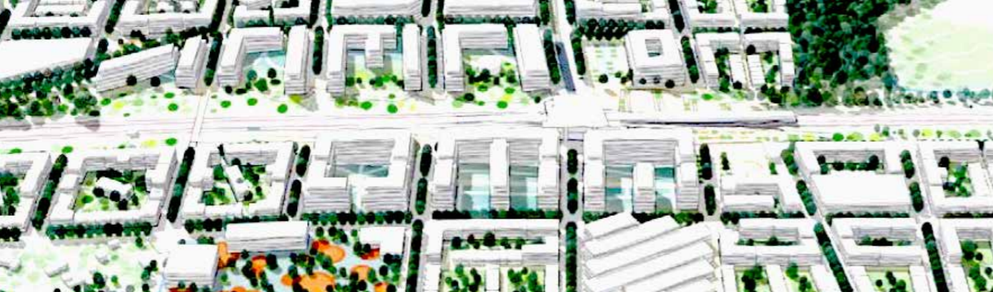
SÖDRA STADEN. Bilden är från Uppsala kommuns digitala modell över det nya planerade området längs järnvägen mot Stockholm.