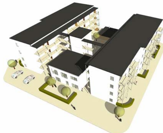
Kollektivhuset Landgången i Annestad, Malmö

Barbro Westerholm som är ordförande i äldreboende-delegationen och riksdagsledamot kommer att introducera det första delbetänkandet från delegationen, "Bo för att leva" SOU 2007:123. Detta handlar om ett övergripande perspektiv på äldreboendet där målsättningen är att utveckla ett nätverk av olika typer av boendeformer där tillgänglighet, gemenskap och trygghet tillgodoses.