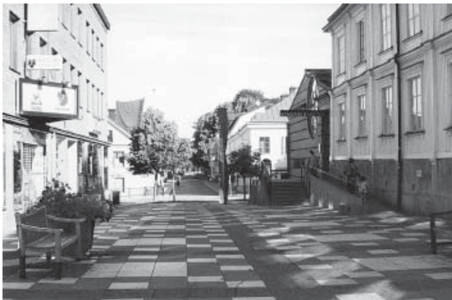
Svarbäcksgatan i Uppsala är numera gågata mellan Stora Torget och Stadsbiblioteket. Fram till 1959 var här genomfartsled för biltrafiken mellan Stockholm och Norrland (Bild från s 33).

Massbilismen förvandlar kulturlandskapet genom vidlyftiga motorvägsbyggen och komplicerade. Den här skriften belyser vad det nya färdmedlet inneburit för några stadskärnor utformade långt innan bilen uppfunnits. Bilen behöver plats när den rullar men också när den står stilla, vilket den enligt en skattning gör 96% av sin tid.