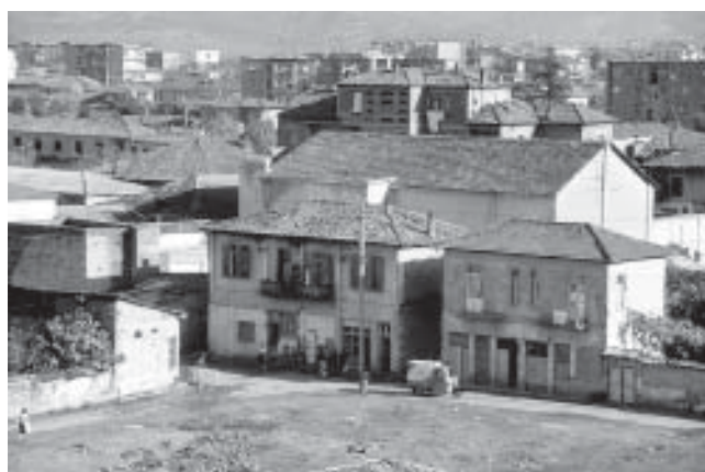
Albanien, utan planering

Diskussionen väcker frågan om hur reglerande och hur möjliggörande planeringen skall vara. På denna punkt skiftar nog föreställningarna i olika kommuner med olika politiska och ekonomiska förutsättningar. Ett skönhetsråd i Stockholm anser sig ha fog för att freda varje liten parkbit och varje fasadyta, medan kommunalrådet i xyz-bruk är villig att dispensera strandskyddet för att få ett enda byggjobb till en kommun som förefaller vara övergiven av staten.