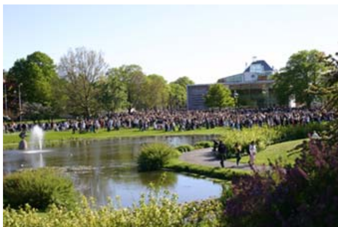
Bostadsbidragen debatteras i Almedalen i sommar

Hur är det då möjligt att nånting sånt här sker utan att det uppmärksammas i den politiska debatten? Det enkla svaret är att nästan ingen, inte ens de som är drabbade, känner till att det har skett. Medan de flesta andra välfärdsprogram är indexerade så att deras värde inte urholkas av inflation och liknande, så gäller detta inte bostadsbidragen. Vare sig bostadskostnadsgränserna eller inkomstgränserna har räknats upp sedan 1995. Genom att inte göra någonting har statsmakten därför kunnat se bidragens reella värde minska, fastän deras nominella värde i kronor och ören varit oförändrat. Ingen minister