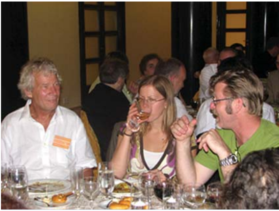
Artikelförfattaren (mitten) vidgar sitt internationella nätverk under konferensmiddagen