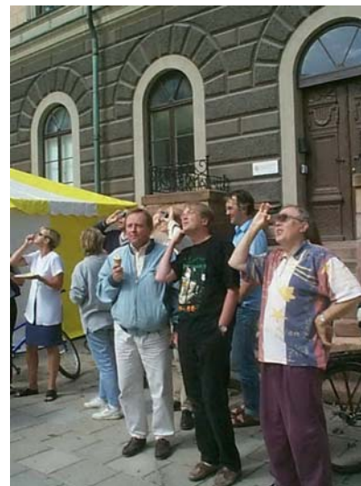
IBF:are på spaning efter EU:s bostadspolitik

Till sist skall det nämnas att det finns starka krafter som verkar för att EU skall uppmärksamma bostadsfrågorna på ett tydligare sätt och som menar att det bör bli ett stopp på gåendet runt den heta gröten. Ett antal organisationer har t ex bildat "European Housing Forum", (EHF) vari bl a ingår FEANTSA (om hemlöshet), CECODHAS (sociala och kooperativa bostadsföretags intresseorganisation), EMF (European Mortgage Federation), UEPC (Union Européenne des promoteurs – constructeurs), Eurocities (en organisation för stora städer i Europa), m fl. En av organisationerna är dessutom ENHR, European Network for Housing Research, som har sitt kansli vid IBF. Detta år är dessutom organisationen genom undertecknad, ordförande för hela EHF.