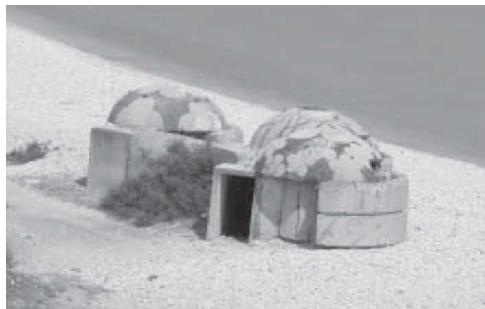
Kanske ett potentiellt lågkostnadsboende? Dekorade bunkrar med vacker havsutsikt i Albanien.

Ur bostadspolitisk synvinkel är utvecklingen besvärande. Staten tappar kontrollen över bostadsbeståndet. Lägenheter som tidigare kunde disponeras för ett bostadssocialt syfte är nu inte längre tillgängliga för den offentliga bostadspolitiken. Det är dessutom svårt att införa ett bostadsbidragssystem, eller ett stödssystem för nyblivna och fattiga ägare, eftersom de offentliga inkomstuppgifterna är så osäkra. I Ukraina räknar man med att uppemot 50 procent av de verkliga inkomsterna förblir orapporterade. I både Ukraina och Albanien finns nu planer på att återinföra en social bostadssektor för att härbärgera socialt utsatta hushåll.