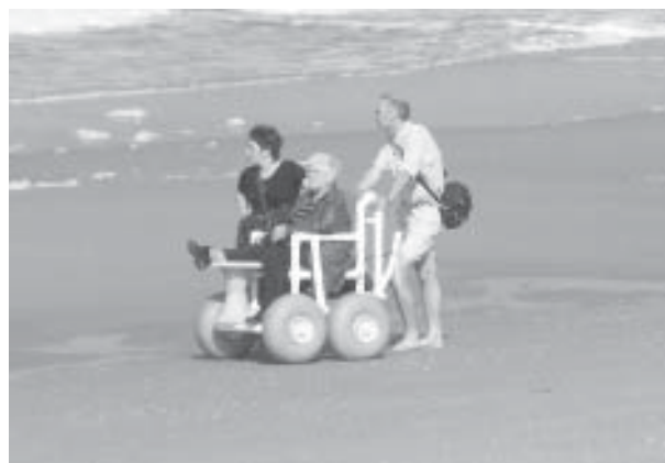
En praktisk rullstol att ta sig fram med längs Nederländernas många stränder.