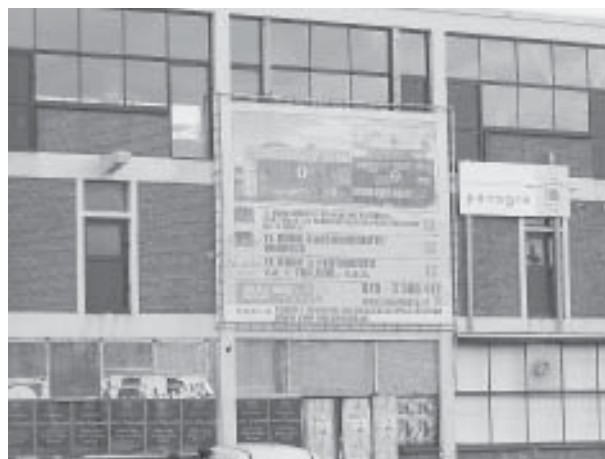
Gamla magasin på väg att konverteras till dyra lyxlägenheter.