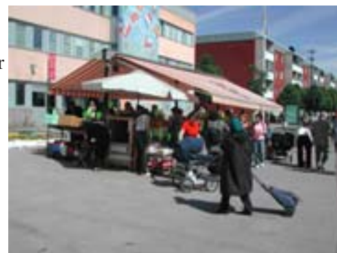
Minskad segregation med Alliansens politik? Foto från Tensta centrum

Kommer marknads- hyror att införas? Här finns det ett klart besked från Allian- sen. Det kollektiva hyressättnings- systemet skall bibehållas. Det innebär rimligen att hyrorna även fram- gent kommer att vara förhandlings-