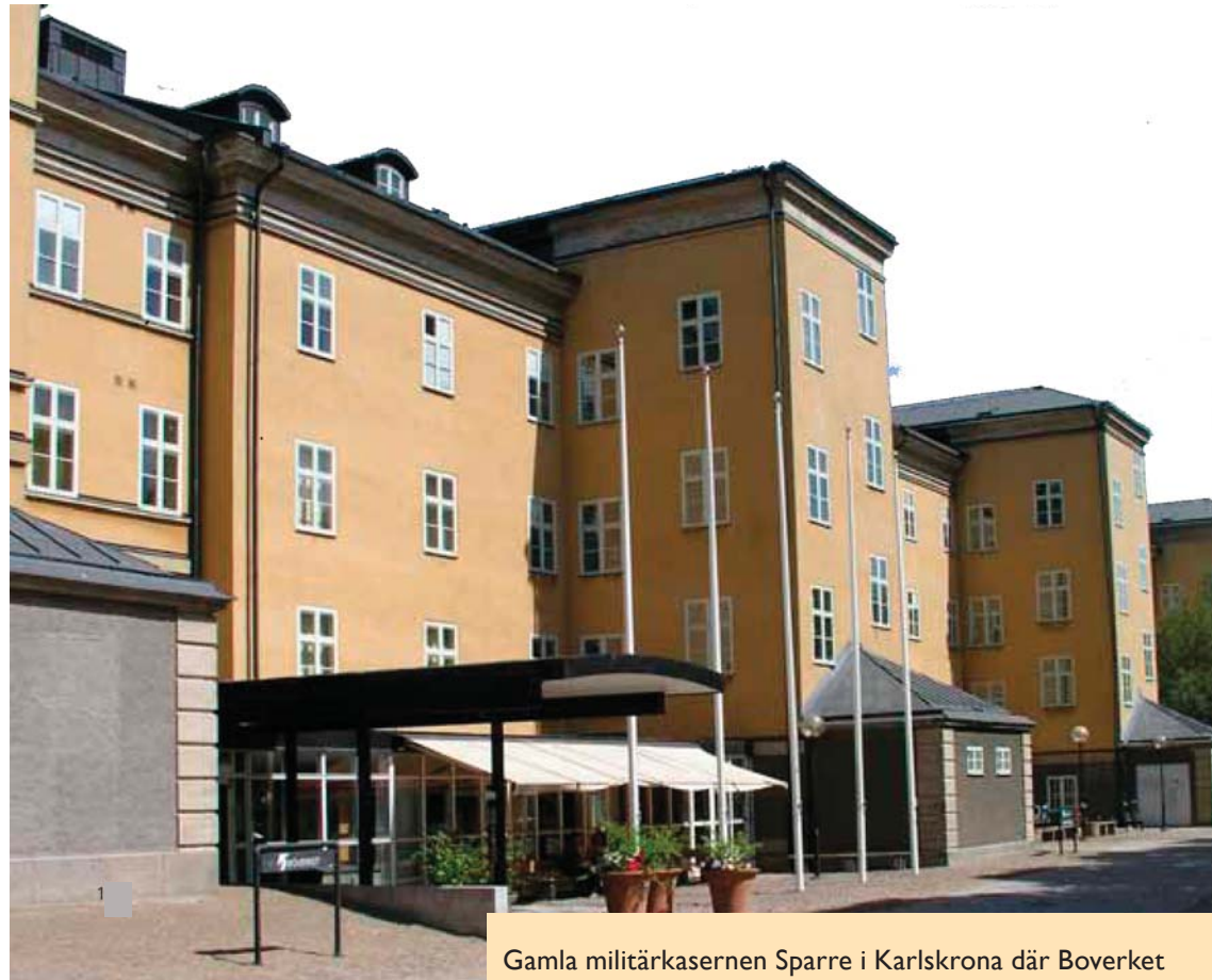
Gamla militärkasernen Sparre i Karlskrona där Boverket är beläget.