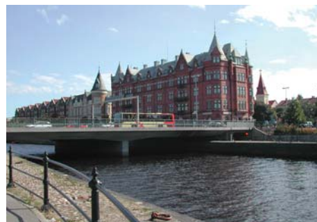
Dalapalatset på Brynäs, Gävle är exempel på attraktivt boende i flerkamiljshus.

För mig känns bilden av bostadsmarknaden i media och i politiken verklighetsfrämmande. Oftast är debatten moraliserande och sällan beaktas, än mindre bejakas, marknadsaktörernas rationella och legitima agerande. Alla verkar tycka att det byggs för få hyreslägenheter. Närmare till hands ligger det att säga att det troligen byggs precis lagom många, nämligen så många som det är lönsamt att bygga med den nuvarande hyreslagstiftningen. Man får intrycket att ombildningarna till bostadsrätter – särskilt i allmännyttans bestånd – är en suspekt verksamhet nästan på gränsen till kriminell. Men jag skulle snarare säga att det är en högst naturlig process, som alla berörda parter, både köpare och säljare, är väldigt nöjda med. Alla partier och intresseorganisationer verkar vilja ”stärka hyresrätten”. Men när får vi höra talas om effekter på bostadsbyggnad som går att härleda tillbaka till