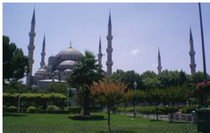
Blå mosken i Istanbul.

Årets konferens hade temat "Urban Dynamics and Housing Change" och under den titeln ägde 25 stycken spännande workshops rum i olika lokaler i den vackra Taskislabyggnaden, belägen nära