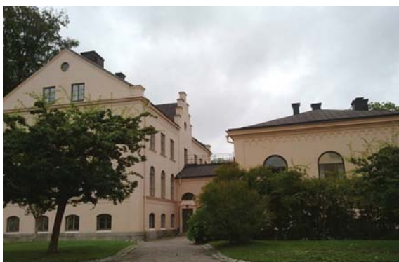
Kvarteret Munken. IBF:s nya lokaler i Uppsala.

IBF-forskare har sinsemellan under många år fört en diskussion om för- och nackdelar med den rådande situationen och efter en omfattande process beslutade IBF:s styrelse under 2010 att undersöka förutsättningarna för att flytta institutet. I detta beslut betonades