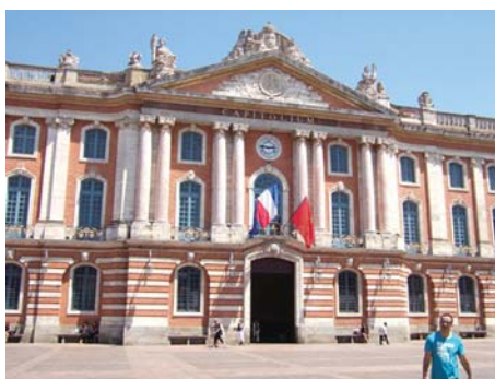
Rådhuset le Capitole i Toulouse.

ENHR-konferensen bestod emellertid av mer än enbart paneldebatter. Årets konferens i Toulouse inleddes, liksom tidigare konferenser, med ett flertal exkursioner. Exkursioner som visade olika aspekter av Toulouse stadsutveckling, från historiska vandringar till exkursioner i stadens nya utvecklingsområden.