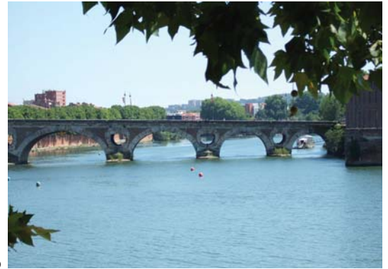
Den vackra bron över Garonne.

De inledande exkursionerna är alltid uppskattade genom att de ger en bild av vördlandet och staden, de utmaningar som de står inför och hur de hanterar olika aspekter av stadsutveckling.