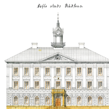
Reple slado Rådhus.