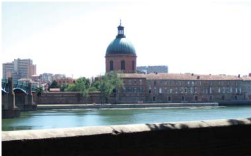
Floden Garonne i Toulouse.

En av de mest debatterade frågorna inom bostadspolitiken under de senaste decennierna har varit hur man kan motverka segregation och de negativa effekter som segregationen medför för enskilda individer och för samhället. En av de strategier som lanserats av politiker i ett flertal länder i Europa, Nordamerika och Australien har varit att försöka skapa mer socialt och etniskt blandade boendemiljöer. Temat för årets ENHR-konferens "Mixité: an urban and housing issue? Mixing people, housing and activities as the urban challenge of the future" är därmed ett tema i tiden.