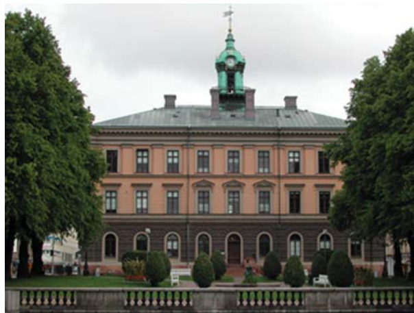
IBF:s nuvarande lokaler i det vackra rådhuset i Gävle

vikten av att dels få funktionella lokaler i ett attraktivt läge i Uppsala, dels att stor hänsyn måste tas till den delen av personalen som arbetar vid IBF men bor i Gävle. Huvudmotivet för att flytta har varit att skapa maximalt goda förutsättningar för den fortsatta forskningen och förhoppningen är att vi säkerställer hård konkurrens vid tjänstetillsättningar, ger flera möjlighet att delta i våra seminarier och ökar den dagliga närvaron vid institutet.